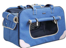
ペットバッグ × 1