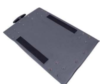
ハンドル付台車 × 1