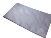
中敷きマット × 1